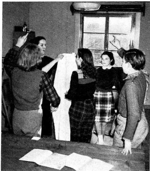
Démonstration dans une école.

Par de nombreuses questions qui montrent leur besoin d'en savoir plus! Par un grand enthousiasme, des réponses justes, un désir très grand d'apprendre à secourir (et d'avoir surtout l'occasion de le faire!). Leurs cahiers bien tenus, richement illustrés, leurs devoirs montrent