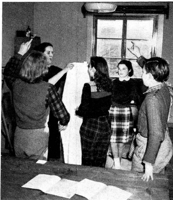
Démonstration dans une école.

Par de nombreuses questions qui montrent leur besoin d'en savoir plus! Par un grand enthousiasme, des réponses justes, un désir très grand d'apprendre à secourir (et d'avoir surtout l'occasion de le faire!). Leurs cahiers bien tenus, richement illustrés, leurs devoirs montrent