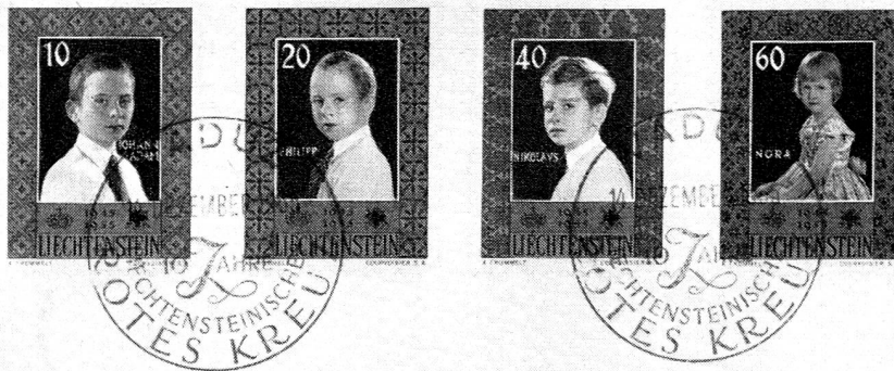
Liechtenstein. — 1955, 10 e anniversaire de la Croix-Rouge: T. 1 à 4 et oblitération 1 er jour 0.1

Signalons qu'une des valeurs de la série de bienfaisance avec surtaxe émise le 15 novembre par la République fédérale allemande, le 40 + 10 Pf., est consacrée à l'infirmière Florence Nightingale. Les autres valeurs représentent Amalie Sieveking (7 + 3 Pf.), Ad. Kolping (10 + 5 Pf.), et le docteur S. Hahnemann (20 + 10 Pf.).