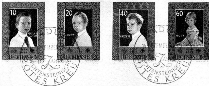
Liechtenstein. — 1955, 10 e anniversaire de la Croix-Rouge: T. 1 à 4 et oblitération 1 er jour 0.1

Signalons qu'une des valeurs de la série de bienfaisance avec surtaxe émise le 15 novembre par la République fédérale allemande, le 40 + 10 Pf., est consacrée à l'infirmière Florence Nightingale. Les autres valeurs représentent Amalie Sieveking (7 + 3 Pf.), Ad. Kolping (10 + 5 Pf.), et le docteur S. Hahnemann (20 + 10 Pf.).