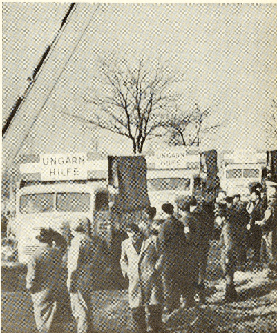
Les premiers secours de la Croix-Rouge franchissent la frontière austro-hongroise.

Le camp de vacances de Vaumarcus pour enfants diabétiques