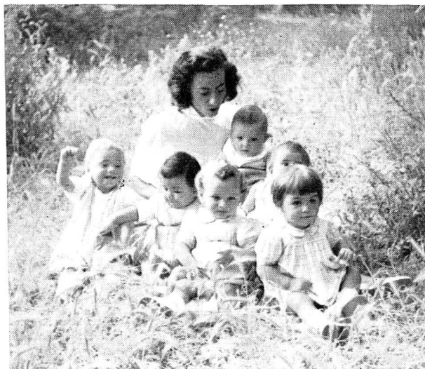
A Cannes, les bébés de la pouponnière dans le jardin de rêve et de soleil.