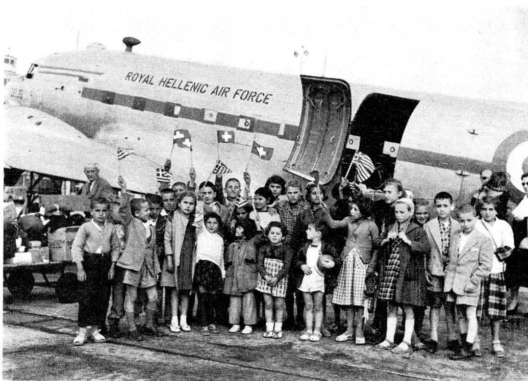
L'arrivée à l'aéroport de Genève du premier avion militaire amenant les enfants grecs en Suisse.

M. Haug a fait une conférence ayant pour thème « La misère en Grèce; l'aide apportée à ce pays » lors de l'assemblée générale de la section zuricoise de la Croix-Rouge suisse, le 6 juin.