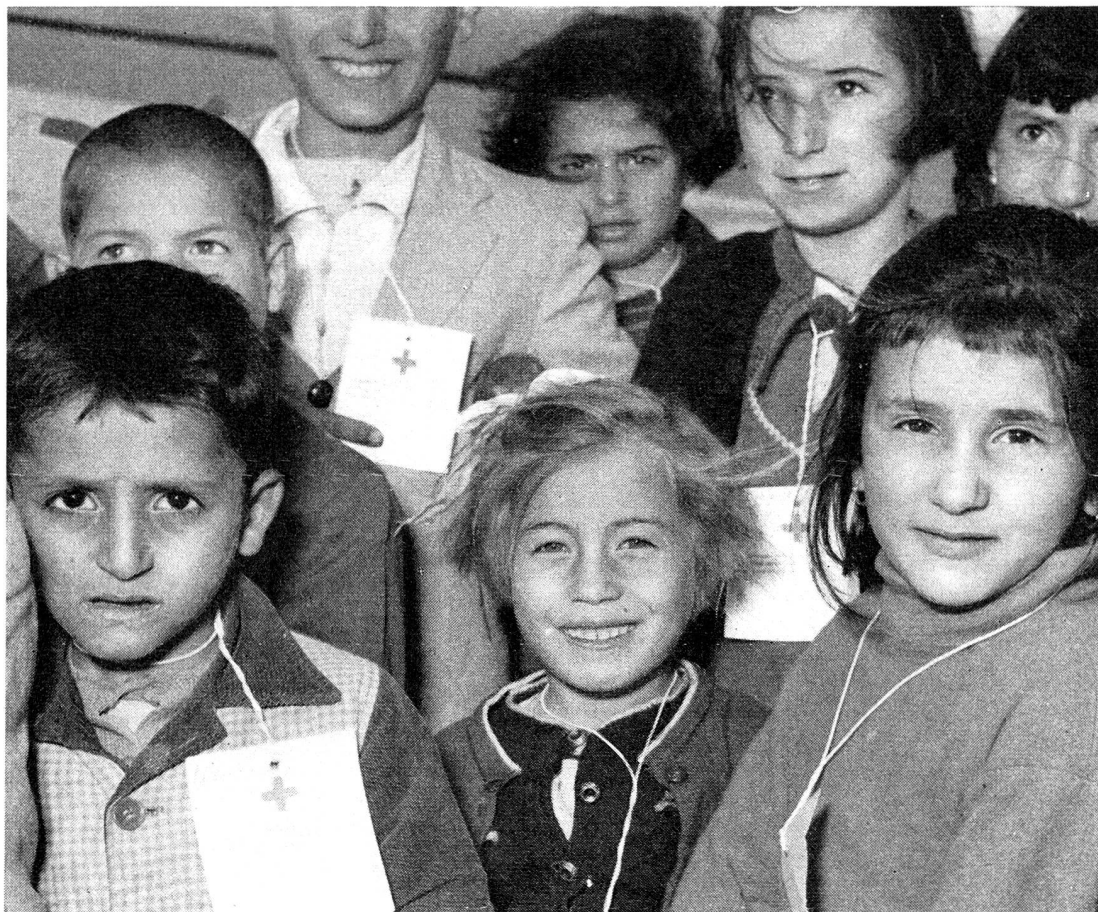
Un groupe des enfants grecs soignés au préventorium « Beau-Soleil » de la Croix-Rouge suisse à Gstaad lors de leur débarquement à Genève.