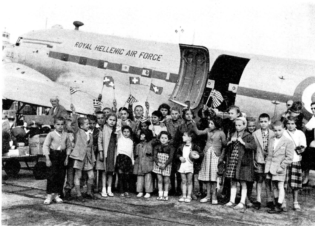
L'arrivée à l'aéroport de Genève du premier avion militaire amenant les enfants grecs en Suisse.

M. Haug a fait une conférence ayant pour thème « La misère en Grèce; l'aide apportée à ce pays » lors de l'assemblée générale de la section zuricoise de la Croix-Rouge suisse, le 6 juin.