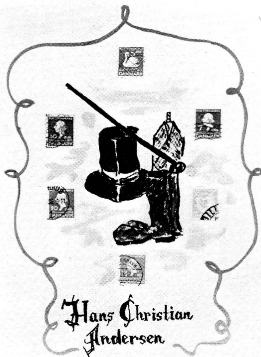
Une page de l'album de timbres danois: les timbres commémoratifs d'Andersen.