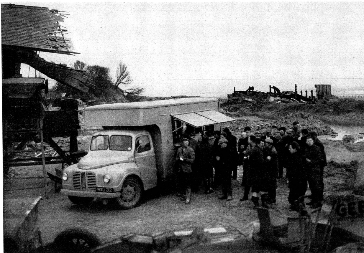
Cantine ambulante d'une colonne volante de ravitaillement servant des repas aux sinistrés de Sutton-on-Sea lors des inondations de février 1953.

fourgon pour le personnel) ainsi que 5 motocyclettes pour les liaisons furent créées pour porter secours aux populations des cités bombardées. Ces unités servirent également sur le continent à la fin de la guerre. Elles permettaient de préparer et de servir des repas chauds — 160 rations d' \frac{1}{2} litre environ par chaudière, 14 chaudières par colonne, soit environ 2200 rations.