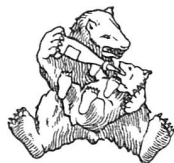
Marque à l'Ours