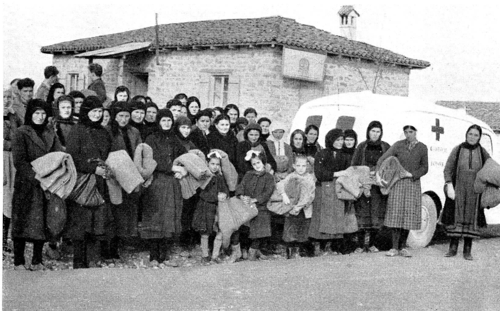
Trois cents couvertures de laine envoyées par la Croix-Rouge suisse ont pu être distribuées dans le nord de la Grèce. Voici la remise, à Kozani, le 20 décembre, des couvertures suisses à des mères de famille, dont beaucoup sont veuves, par la Croix-Rouge hellénique.

La sezione ha organizzato nel 1955 la colletta e la vendita di distintivi in tutto il Mendrisiotto. Causa malattie e interventi chirurgici furono aiutate alcune famiglie bisognose che fecero appello alla Croce Rossa.