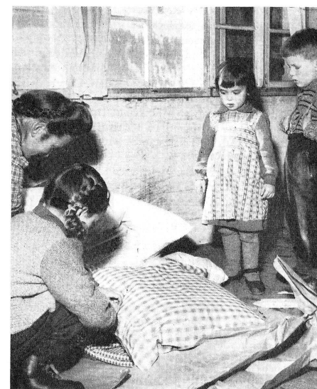
Que de travail pour débarrasser ces richesses et se persuader qu'elles sont à vous!

Le dégel qui a provoqué, au début de mars, des inondations dans le nord de la France qui ont causé de gros dégâts, a produit aussi de graves glissements de terrain en Italie dans la province de Teramo, dans les Abruzzes, où trois villages ont été détruits et les cultures ravagées. Il en a été de même dans bien d'autres pays, en Autriche notamment, et surtout en Hongrie où trois villes et douze villages au sud de Budapest ont été inondés et 100 000 personnes évacuées. Le 16 mars, la Ligue a adressé une offre d'entraide internationale à la Croix-Rouge hongroise en faveur des sinistrés.