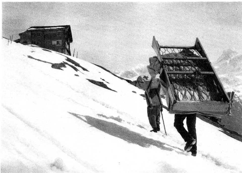
Mille lits ont pu être donnés à des enfants suisses grâce aux parrainages du Secours aux enfants de la Croix-Rouge suisse.

Aarau, 2; Arbon, 4; Auenstein, 2; Baden, 1; Bâle, 9; Berne, 10; Brugg, 2; Château-d'Œx, 1; Dietikon, 2; Gondo, 1; Hinterkappelen, 1; Hinwil, 1; Wiesen, 1; Lachen, 2; Langenthal, 1;