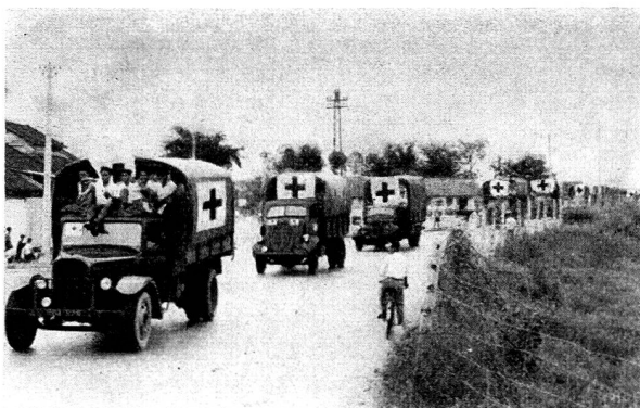
Une colonne de 46 camions porte des secours aux réfugiés dans le Sud-Vietnam.

Une des dirigeantes du Bureau de la Croix-Rouge de la Jeunesse de la Ligue des sociétés de la Croix-Rouge