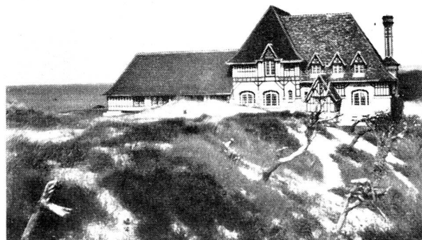
La belle colonie de Cabourg.