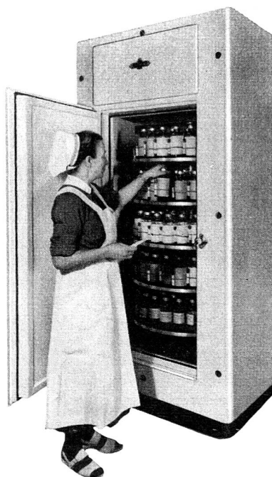
Armoire frigorifique spéciale pour la conservation du sang

Frigidaire REFRIGERATION ET CLIMATISATION AUTOMATIQUE MARQUE DÉPOSÉE PRODUIT DE GENERAL MOTORS