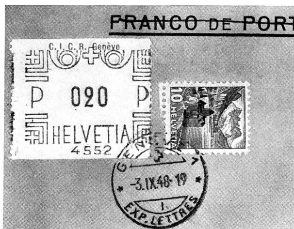
Un affranchissement du C. I. C. R. (Etiquette pour machine à affranchir M. 2 de notre catalogue croix-rouge).

Le nouveau règlement des Postes de 1910 mit fin à ce régime libéral. Il instituait, dès le 1 er janvier 1911, des timbres de bienfaisance de franchise de port, destinés aux œuvres dont le but charitable ou social était reconnu. Ces timbres, d'une valeur d'affranchissement respective de 2, 5 et 10 centimes, étaient remis gratuitement à ces œuvres à concurrence d'un montant de fr. 3.— par an et par lit pour les établissements hospitaliers, de fr. 3.— par an et par enfant pour les orphelins et les asiles, de 25 centimes par enfant pour les colonies de vacances. L'attribution totale ne pouvait