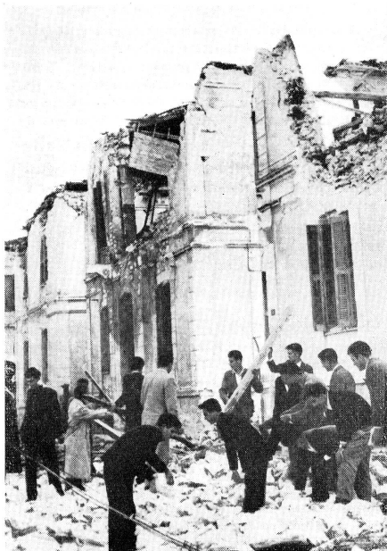
La catastrophe de Volos où un tremblement de terre a détruit cette ville de 70 000 habitants.