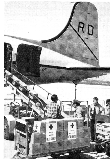
De l'aéroport de Cointrin, des secours de la Croix-Rouge ont été envoyés immédiatement en Grèce.

Le Comité central a voté un crédit de fr. 5700 pour l'achat de 100 matelas et un crédit de fr. 4000 pour du matériel destiné aux cours samaritains.