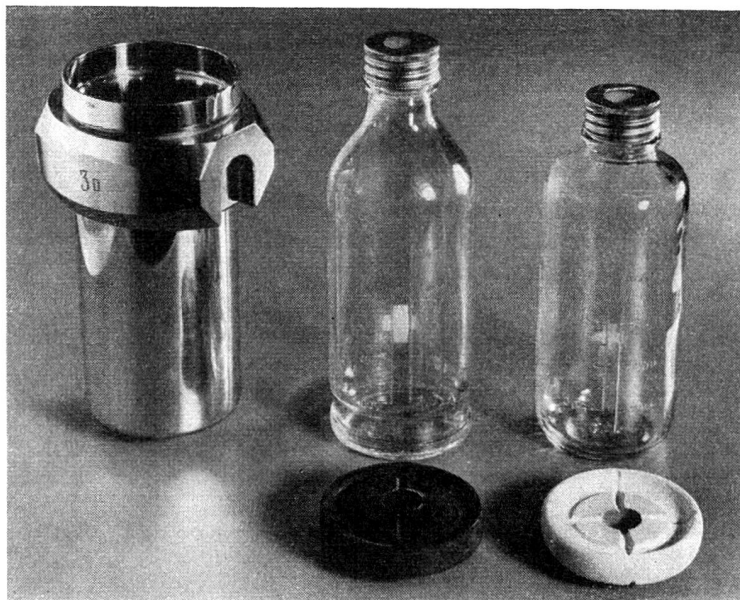
En haut, le porte-bouteilles d'un appareil centrifuge avec des bouteilles à sang et à plasma.