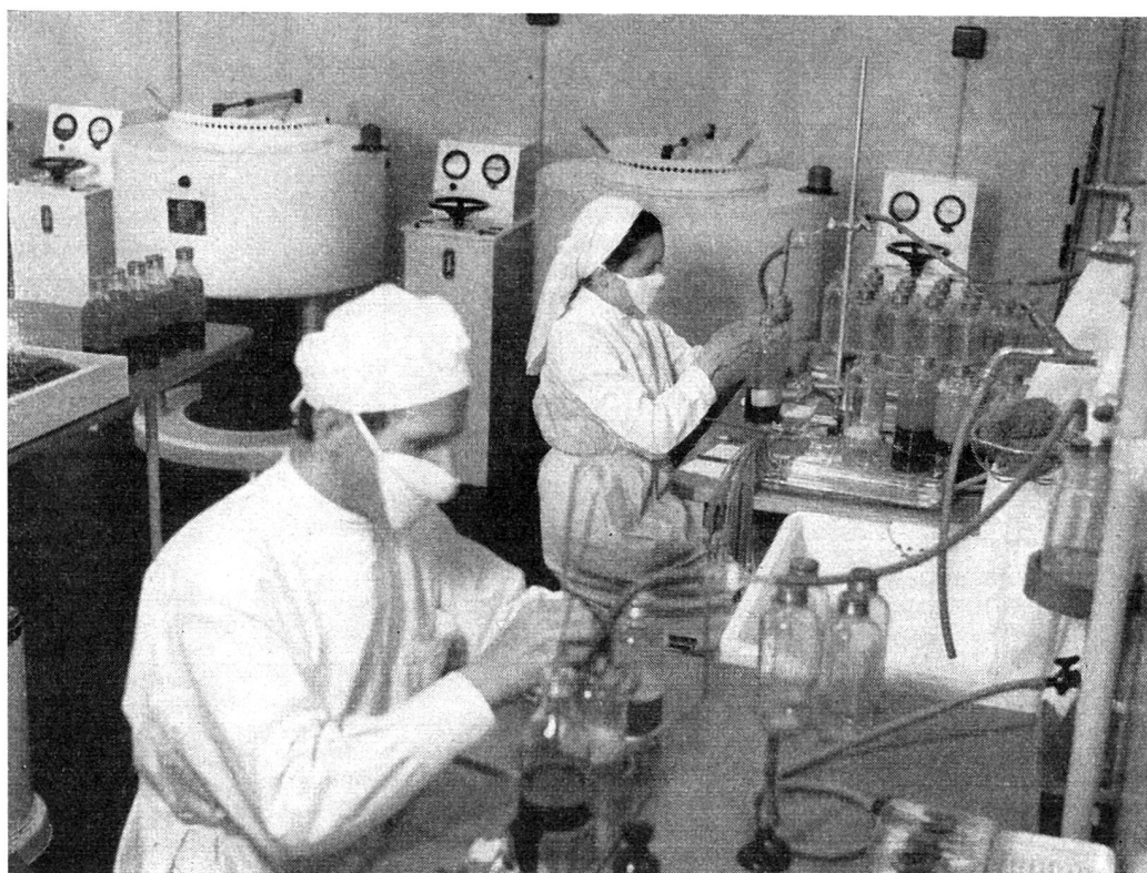
En bas, la salle des appareils centrifuges et la récolte du plasma.