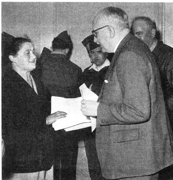
M. de Salis, ministre de Suisse à Paris, interroge une sinistrée de Villeneuve-Saint-George.

Le Conseil fédéral avait remis, comme nous l'avons signalé, à la Croix-Rouge suisse une somme de 50 000 francs pour le financement d'une action de secours en faveur des victimes des inondations en France. En accord avec la Légation de Suisse de Paris et les organismes français de secours, la Croix-Rouge suisse a utilisé cette somme à l'achat de literie. 4500 mètres de toile à matelas, 1000 couvertures et 1200 draps de lit ont été expédiés à la Croix-Rouge française.