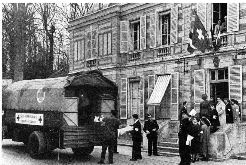
Les équipes de secouristes de la Croix-Rouge déchargent à la mairie de Villeneuve-le-Roi le matériel de secours envoyé par la Suisse pour les sinistrés des inondations.

Les examens de diplôme ont eu lieu dans les écoles d'infirmières suivantes: La Source, du 22 au 24 mars; Ecole bernoise d'Engeried, 28 mars; Maison de diaconesses de Berne et Ecole de gardes-malades de Zürich, 28 et 29 mars; Lindenhof, 29 et 30 mars; Diaconesses de