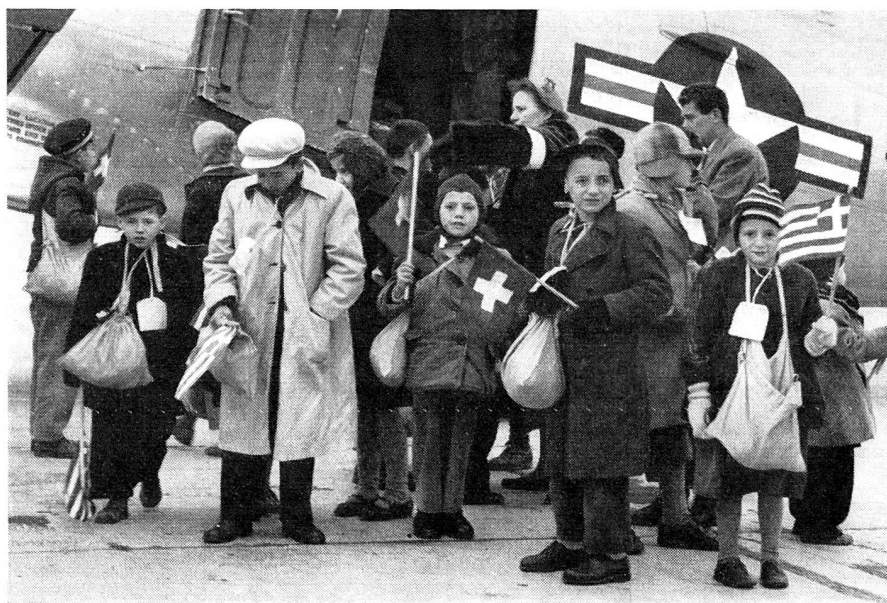
L'arrivée à Cointrin d'un des avions militaires amenant les enfants grecs qui vont passer quatre mois au préventorium de Gstaad.

Le 2 mars en fin d'après-midi, un avion militaire a amené à Cointrin 18 enfants grecs ayant urgent besoin d'un séjour en préventorium d'altitude et qui ont été accueilli à notre préventorium de Beau-Soleil à Gstaad. Le 7 mars, ils y étaient rejoints par 20 autres enfants également venus d'Athènes par avion militaire. Ces enfants, qui appartiennent à des familles grecques d'Asie mineure ou établies en Roumanie, en Grèce ou en