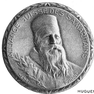
HUGUENIN LE LOCLE

nombrables missions pour la Croix-Rouge suisse et le Secours suisse de 1940 à 1947 (Finlande, France, Allemagne, Buchenwald) appelaient cette consécration.