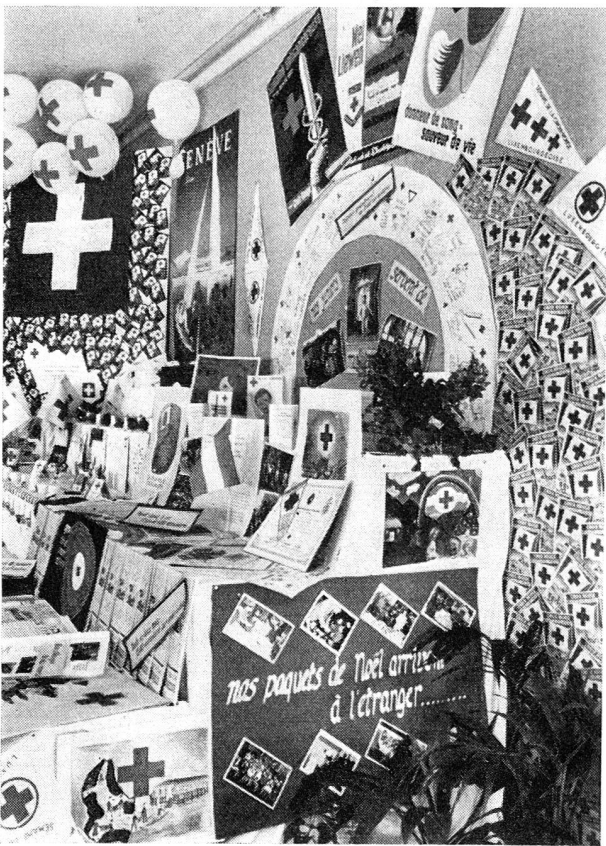
L'exposition organisée par les «juniors» à Bertrange.

Partagés en trois équipes, et deux d'entre elles virent des représentants romands élus à leur tête, les «juniors» réunis au Camp de Bertrange se livrèrent à de nombreux travaux pratiques — secourisme, confection d'albums, préparation d'une exposition croix-rouge, rédaction du journal du camp, travaux manuels, etc. C'est là un excellent encouragement au développement chez nous des groupes de «juniors» croix-rouges.