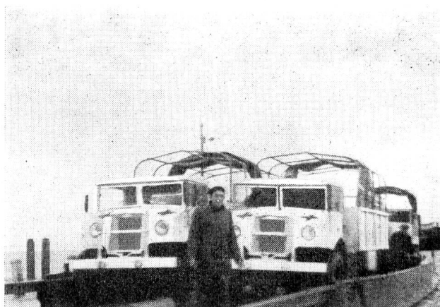
Deux camions du C. I. C. R. ont été placés sur le bac qui va les conduire à pied d'œuvre.

Les camions du C. I. C. R. rentraient également à Genève le 14 février, ayant utilement collaboré avec leurs chauffeurs aux travaux de sauvetage et à la réfection des digues.