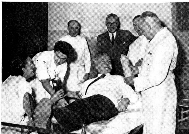
Lors de la prise de sang qui a eu lieu à Genève le 26 novembre, un des donateurs volontaires se vit fêté à sa grande surprise: on venait d'effectuer sur lui la 10 000 e prise de sang de l'année!

Divers travaux ont été en outre entrepris en collaboration avec notre laboratoire central, notamment par M. H. Habich (recherches sur la spécificité des albumines pathologiques résultant de la macroglobulinémie de Waldenström) et du Dr Willenegger, médecin-chef de la clinique chirurgicale de l'Hôpital des bourgeois de Bâle (durée de la présence dans l'organisme des substances de remplacement du plasma portant des traces radioactives).