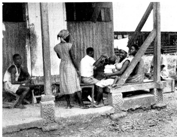
Malades indigènes et leur famille devant la case où ils logent.

Si le visiteur de Lambaréné, troublé, étonné par l'indolence, la misère et l'insouciance des