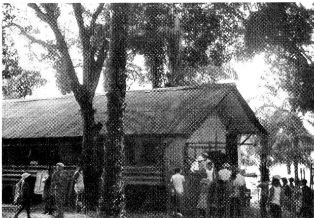
A Lambaréné, une des nombreuses cases du village-hôpital.

infirmière blanche et quelques infirmiers indigènes sont spécialement attachés au village des lépreux. Ceux-ci habitent des cases de bambous qu'ils construisent eux-mêmes et leur vie, comme celle de tous les malades, est très semblable elle aussi à celle qu'ils avaient dans leurs villages.