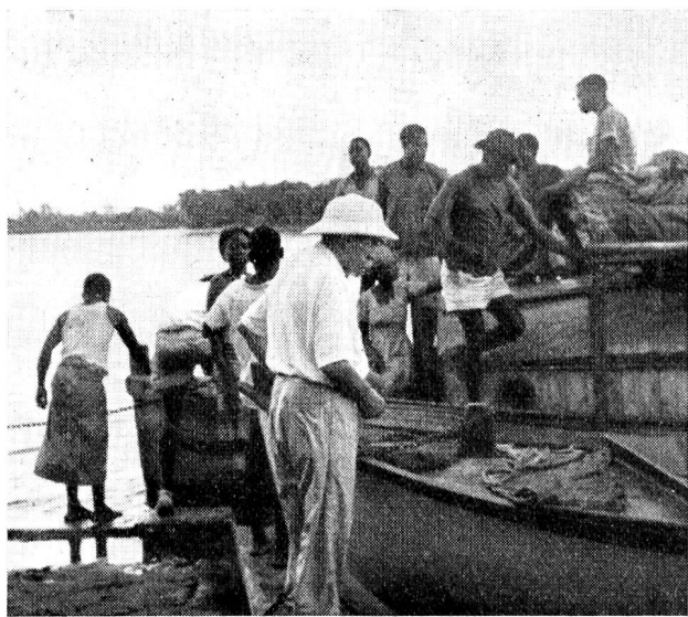
Le Dr Schweitzer au port des pirogues sur l'Ogooué.

Au bord du fleuve, un groupe électrogène,