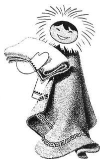
Couvertures de Pfungen