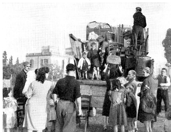
Enfants et bagages s'entassent sur le camion. En route vers le nouveau logis!

Le plan du village est simple, mais il est rationnel. Au centre, donnant sur une place, entourée de magasins, sera bâtie, aux frais du Vicariat, l'église du nouveau village. A côté un marché couvert trouvera sa place. On érigera l'école au milieu d'un jardin. Dans les rues desservant les différents quartiers commencent à s'ouvrir les premières boutiques. On a prévu