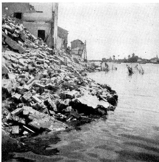
Maisons éboulées sur le Pô.

Une nouvelle aide devint nécessaire lorsque