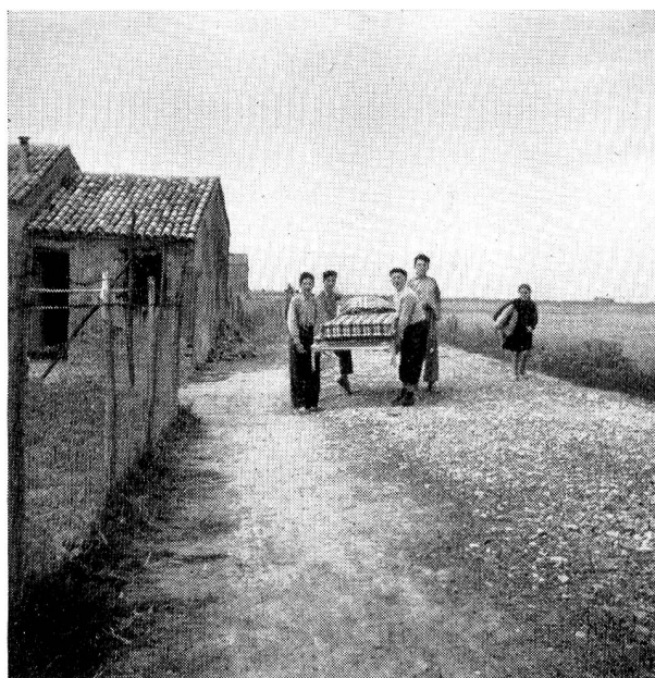
Et voilà le lit glorieusement transporté au domicile d'une famille de sinistrés.

camion s'arrête; une remorque est tendue, le camion repart cahin caha et parvient à la langue de terre ferme où se trouve le hameau. Un pauvre hameau, avec une pauvre auberge, un petit magasin, six ou huit maisons accotées l'une à l'autre, formant le carré, le dos à la mer, et une vieille chapelle portant au-dessus de sa porte romane des armoiries écartelées et trop usées par les vents pour pouvoir être lues encore. La veille on avait déjà apporté et entreposé dans la chapelle une partie du matériel, il est ressorti, des tas sont préparés, un par famille. Les sinistrés auxquels il est destiné sont là. Vieilles femmes vêtues de noir, enfants à