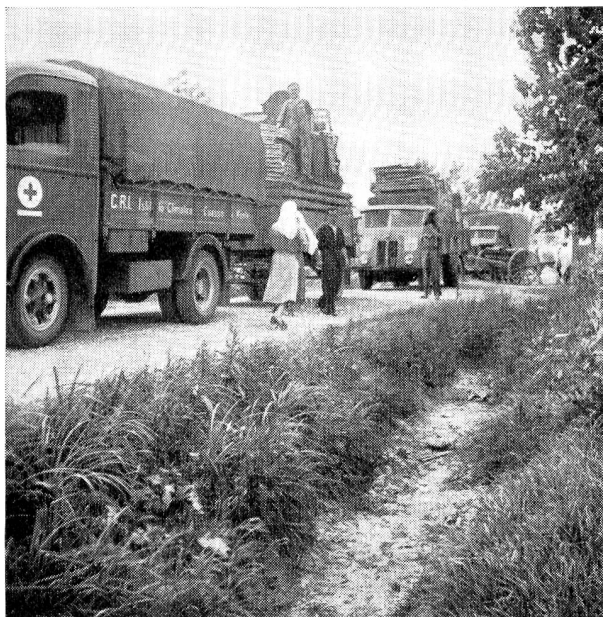
Les camions sont chargés, en route pour une tournée.

les conditions permirent aux sinistrés de regagner leurs foyers dévastés. L'attribution et la distribution de lits, de mobilier, d'ustensiles de ménage ne devenaient possibles et utiles qu'à ce moment, après qu'une enquête conduite sur le territoire de chaque commune eût permis d'évaluer équitablement les pertes et les besoins de chaque famille sinistrée.