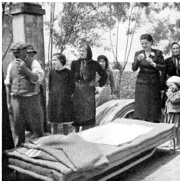
Une famille reçoit un des 2000 lits complets de la Croix-Rouge suisse.

Par de petits chemins, on atteint Cao Marina, où une famille reçut le mobilier, les ustensiles, le gros carton où étaient préparés les vêtements. Second arrêt à Cà Capello: la distribution aura lieu le lendemain, on porte dans la vieille cure délabrée les lits, les matelas, les colis de trois familles confiés à la garde du curé. Le camion repart par le chemin, il longe à gauche le Pô du Levant, des lagunes à droite, la piste cède bientôt et le camion penche dangereusement. L'incident est prévu — le gros «Dodge» de la Croix-Rouge, qui précède le