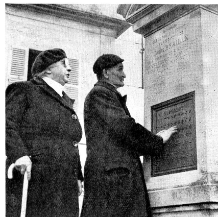
Le monument de Louis Braille.

avait attiré l'attention du monde philosophe et savant, dans sa «Lettre sur les aveugles à l'usage de ceux qui voient», sur la possibilité de leur rééducation; si un Valentin Haüy (1745-1822) avait imaginé le premier une écriture en relief pour les aveugles et entrepris l'œuvre de leur éducation; Louis Braille reste un de ceux qui auront le plus et le mieux servi la cause des invalides frappés de cécité et contribué à les rendre à une vie et une activité sociales.