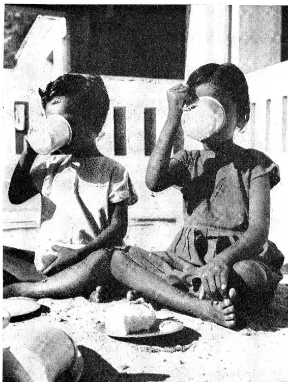
Grâce au don de lait en poudre de la Croix-Rouge américaine, quelque dix millions de rations de lait pourront être préparées aux Indes pour les enfants et les jeunes mères.

Au mois de juillet 1951, lors du quatrième Congrès international de Transfusion sanguine,