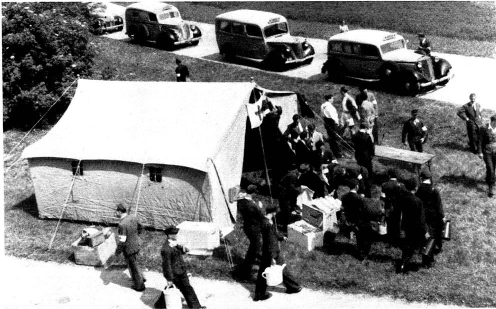
La colonne motorisée du poste de secours Croix-Rouge de Graz lors d'un exercice organisé à l'occasion de la visite de la délégation de la Croix-Rouge suisse.