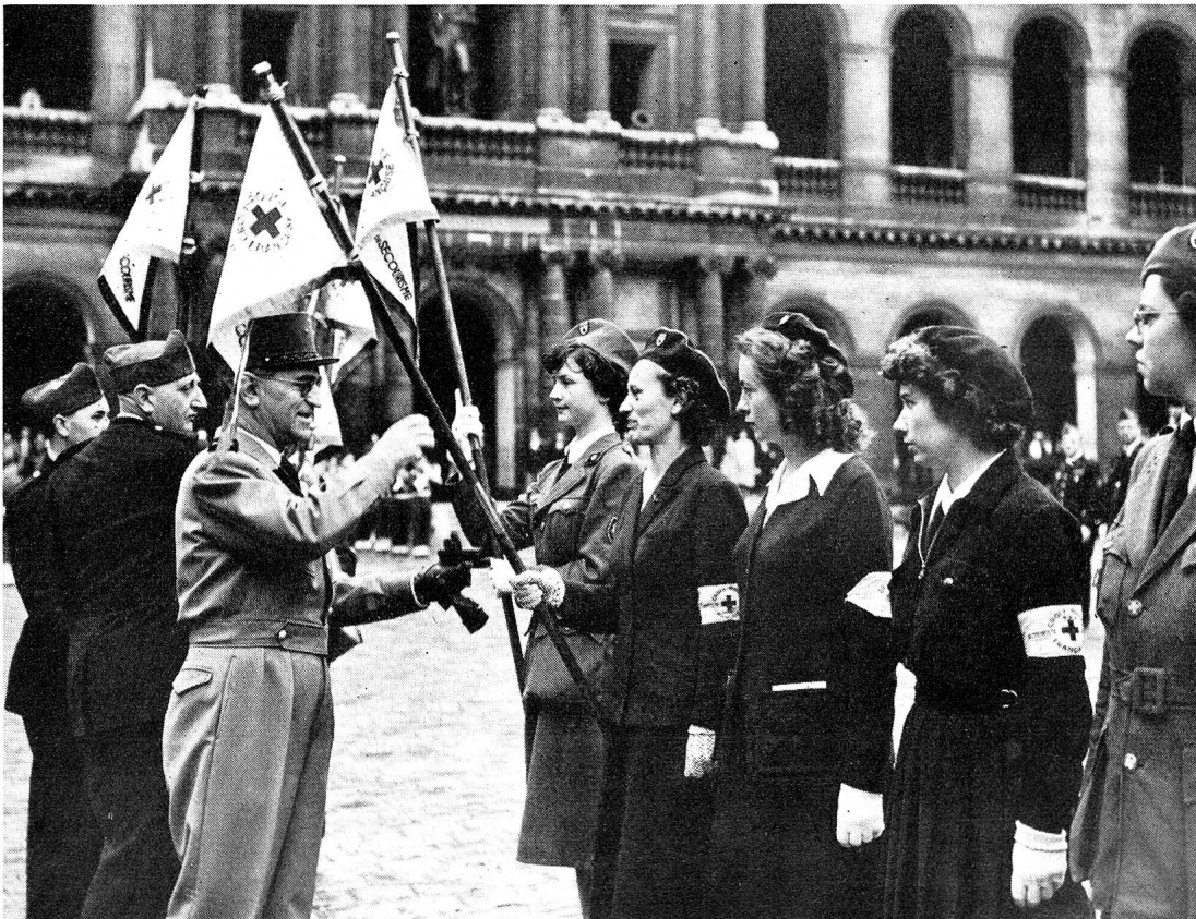
A l'occasion du congrès des secouristes français à Paris, une émouvante prise d'armes eut lieu aux Invalides, au cours de laquelle le Médecin-Général Hugonnot, Inspecteur général du Service de santé militaire, remit des fanions et des décorations.