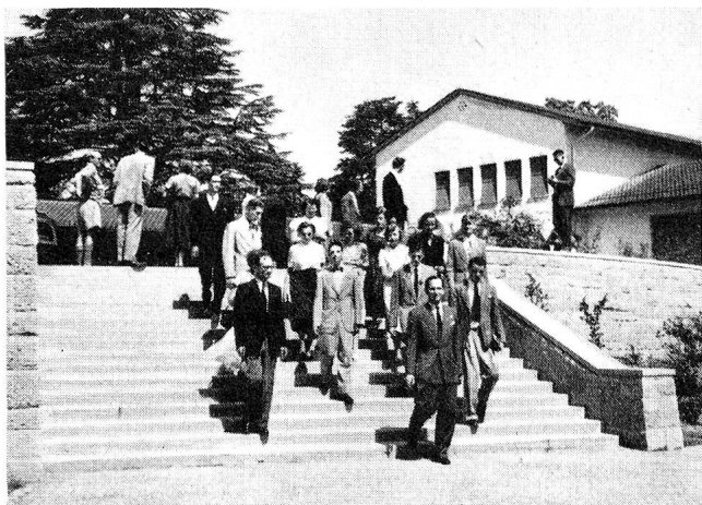
Les Juniors américains visitent le nouveau centre scolaire Trembley, qui est évidemment à l'opposé d'un building puisqu'il ne comprend que deux étages et s'étire largement dans une magnifique campagne aux arbres séculaires.

les chants de leurs pays, le moyen d'unir leurs pensées et de témoigner de leur reconnaissance et de leur attachement à cette Croix-Rouge qui crée l'union par-dessus toutes les divisions. Ces chants ont suffi. Ils ont été beaucoup plus expressifs que n'importe quel discours.