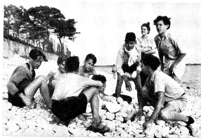
Il y a aussi, quelquefois, des pierres sur les plages de l'Atlantique!