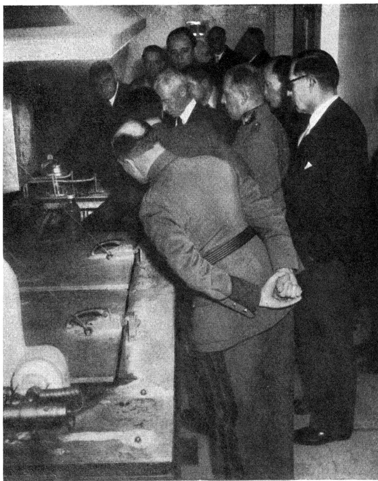
Devant le congélateur rotatif.