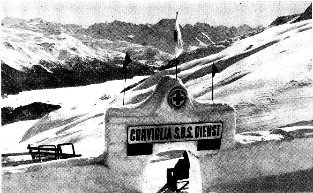
Poste de secours au terminus d'un ski-lift.

Suisse une littérature abondante et instructive. L'agenda 1949 de l'Alliance suisse des samaritains, par exemple, contient plusieurs photographies et clichés Röntgen pris par notre service sanitaire qui a fonctionné durant les Jeux Olympiques d'hiver de 1948. Nous y constatons qu'à l'exception d'un coup de pistolet tiré par un Suédois dans la jambe d'un gendarme grison, pendant le pentathlon militaire, les quelques accidents graves dont il est fait mention se sont produits au cours de compétitions de ski.