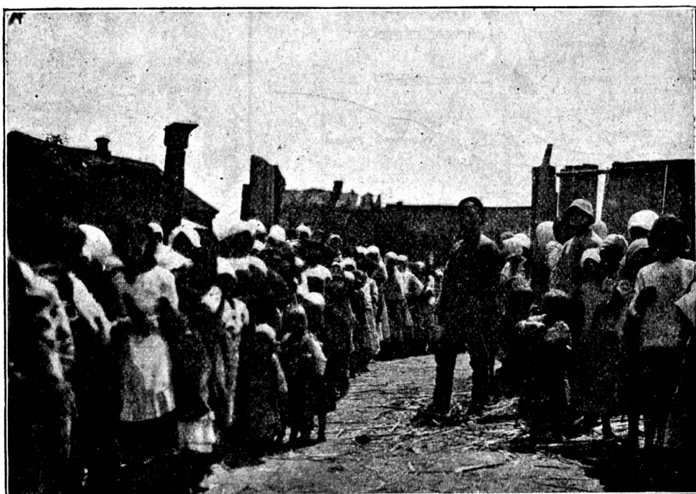
A Tchepourniki-le-Grand (province de Tsaritzine). — Les enfants viennent à la cantine du Comité suisse chercher leur ration.

La ville d'Astrakhan fait une impression très déprimante. Elle est située au-dessous du niveau de la mer et exposée à de fréquents brouillards. Les maisons sont délabrées, les routes couvertes de boue sont parsemées de larges flaques d'eau stagnante où les fondements des