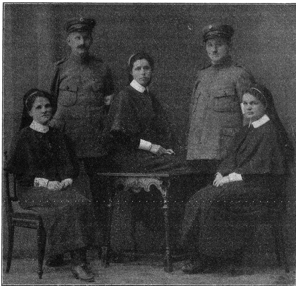
Le personnel de renfort envoyé en Russie.