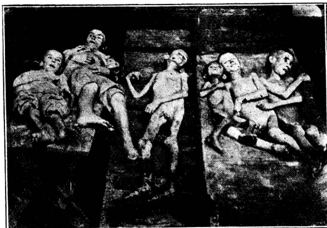
Enfants morts de faim placés sur les marches de l'hôpital d'où ils seront transportés au cimetière.

« Dans les hôpitaux civils, les infirmières ne travaillent qu'une semaine sur