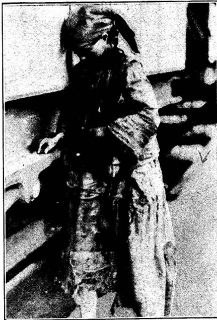
Jeune Russe de la région du Volga couverte de haillons et cherchant des grains de blé sur le châssis d'un fourgon.

Notre délégation a rencontré des témoins oculaires venant des régions affamées; aux dires du Dr Scherz, ces gens racontent que la situation est effroyable. « Il est hautement temps, ajoute le rapporteur, que notre population suisse se rende compte du danger qui menace l'Europe au point de vue des maladies épidémiques. L'ancienne barrière médicale, formée par l'Allemagne et l'Autriche-