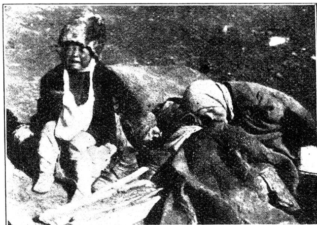
Mère mourante auprès de son enfant, dans la province de Saratov. Tsaritzine, but de l'expédition suisse, est à l'extrémité sud de cette province, à quelque 350 km. de Saratov.

Les denrées transportées en Russie par ce premier convoi comportent en substance: 30 000 kg. de haricots, 6000 kg. de pois, 15 000 kg. de légumes secs, 30 000 kg. de farine, 20 000 kg. de cacao, 5000 kg. de pâtes alimentaires, 750 caisses de lait condensé et de farine pour bébés, 45 000 kg. de riz, 10 000 kg. de graisse, autant de flocons d'avoine et 5000 boîtes de conserves de viande. En outre, 4 fourgons contiennent des dons en nature, spécialement des vêtements.