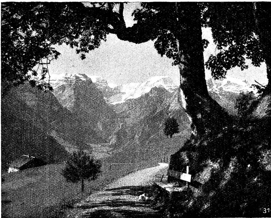
Vue prise de Braunwald: le fond de la vallée de Linthal dominée par le groupe du Tödi.