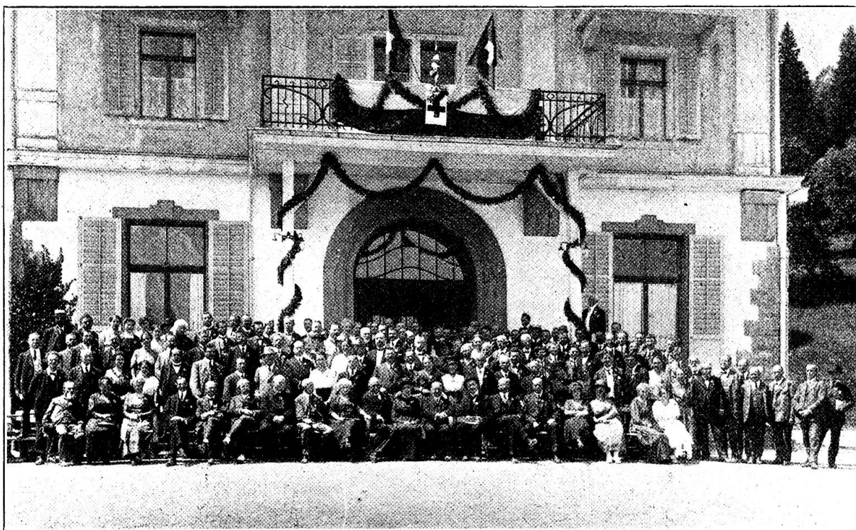
Assemblée générale de la Croix-Rouge suisse, le 26 juin, au Grand Hôtel de Braunwald-Glaris.