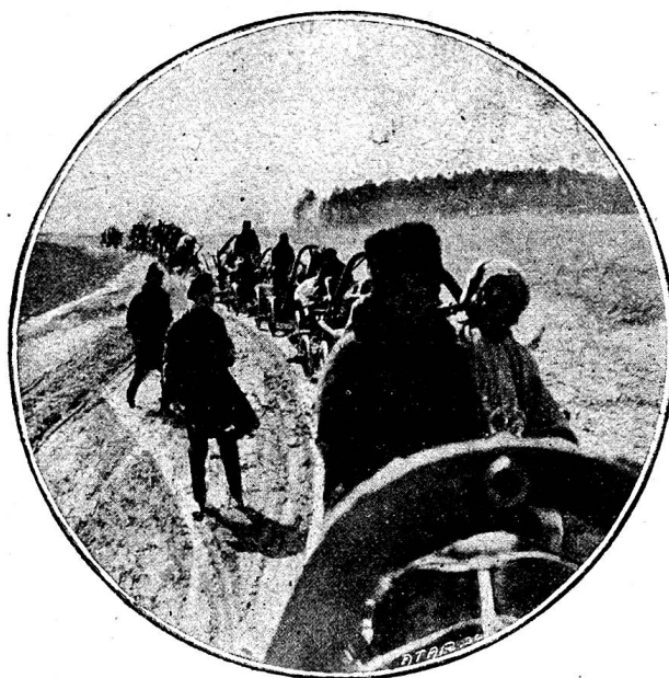
L'équipe mobile de désinfection

L'équipe mobile comprend, outre son personnel spécial, tout le matériel nécessaire. Il est arrivé que l'équipe transporte des milliers de kilos de désinfectants, car il ne s'agit plus seulement ici de la désinfection des personnes et des vêtements, il faut aussi s'attaquer aux maisons et ob-