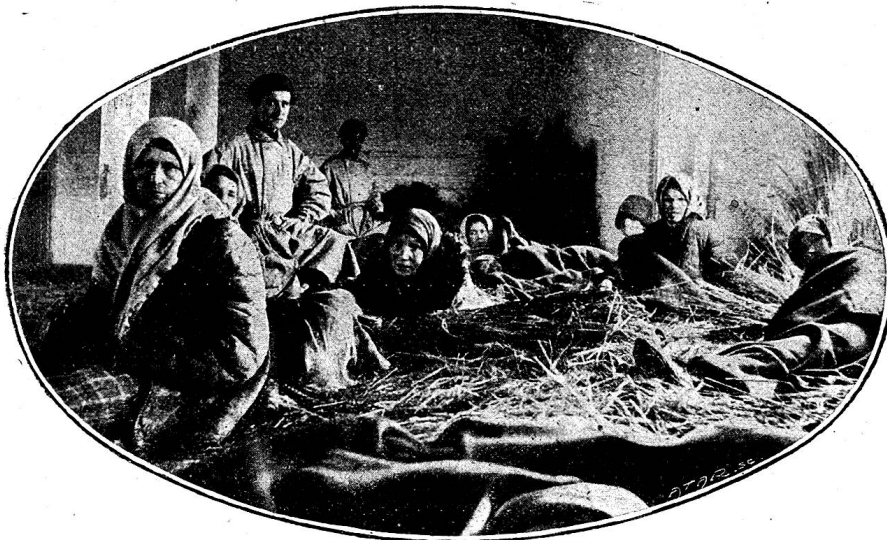
En attendant l'admission à l'ambulance

Les difficultés ne manquent pas, car souvent le public ne comprend pas son intérêt et se montre hostile. Néanmoins presque partout l'équipe est parvenue à ses fins.