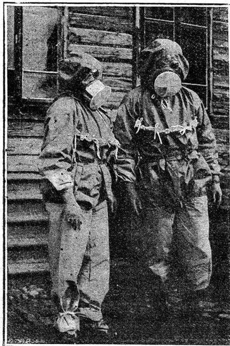
Costumes de protection des désinfecteurs (masques, gants de caoutchouc et sur-vêtements)

Par sa double action, — à l'ambulance même et à l'extérieur grâce à son équipe mobile — la formation sanitaire de la Croix-Rouge suédoise en Pologne accom-