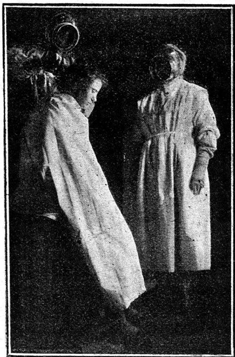
Coupe de cheveux obligatoire faite par des infirmières

vêtements et d'arriver jusqu'à la peau; il est complété par un masque et des gants en caoutchouc.