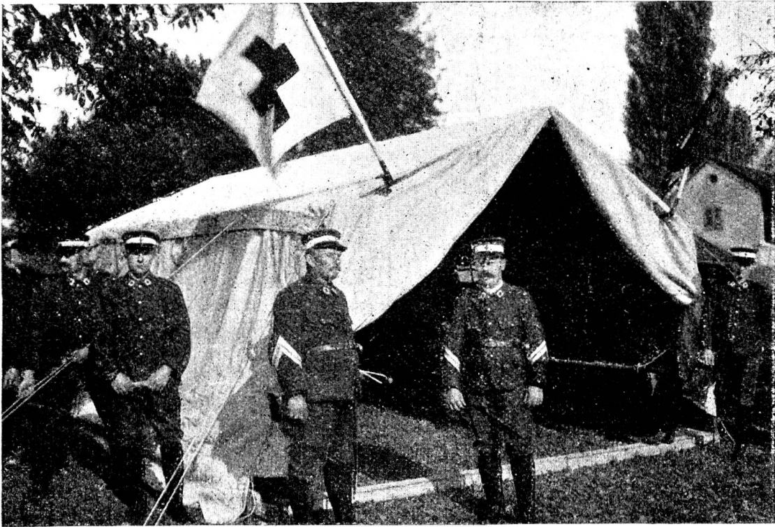
La tente bâloise, montée par les hommes de la colonne de la Croix-Rouge de Bâle, est prête à recevoir des blessés

6° Les lits-brancards fixés sur les côtés laissent une grande place libre au centre