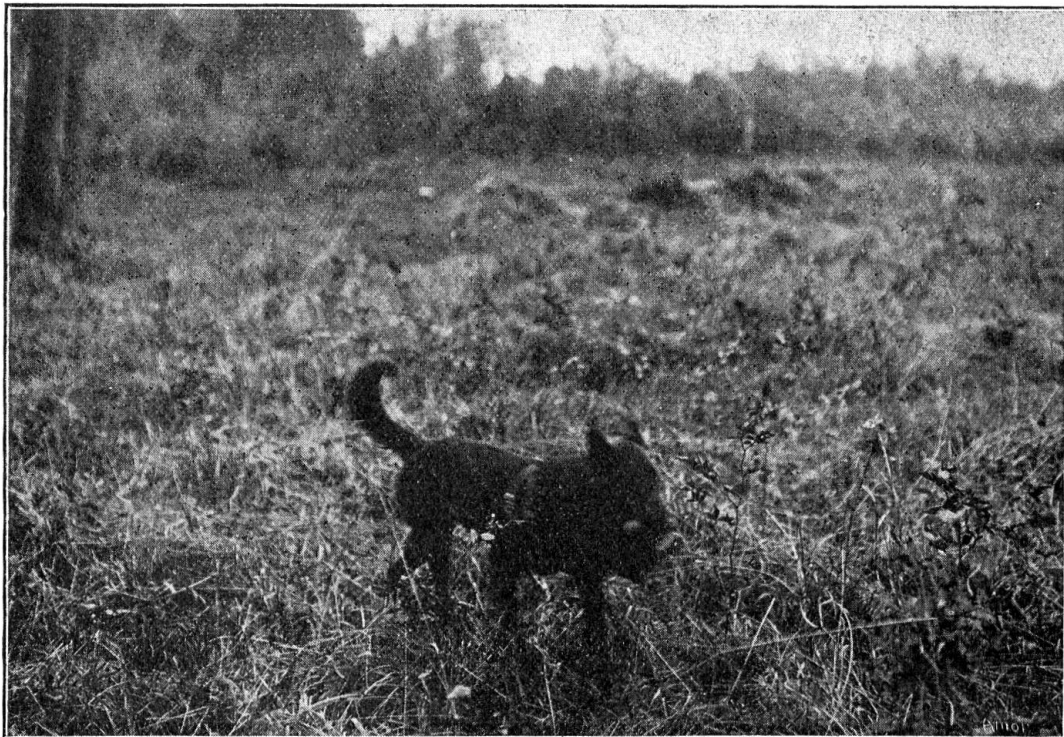
„Hector" apporte le képi qu'il a enlevé à un blessé et vient le déposer aux pieds de son maître

de telle ou telle opération militaire, aurait fait découvrir des blessés, morts dès lors faute de soins.