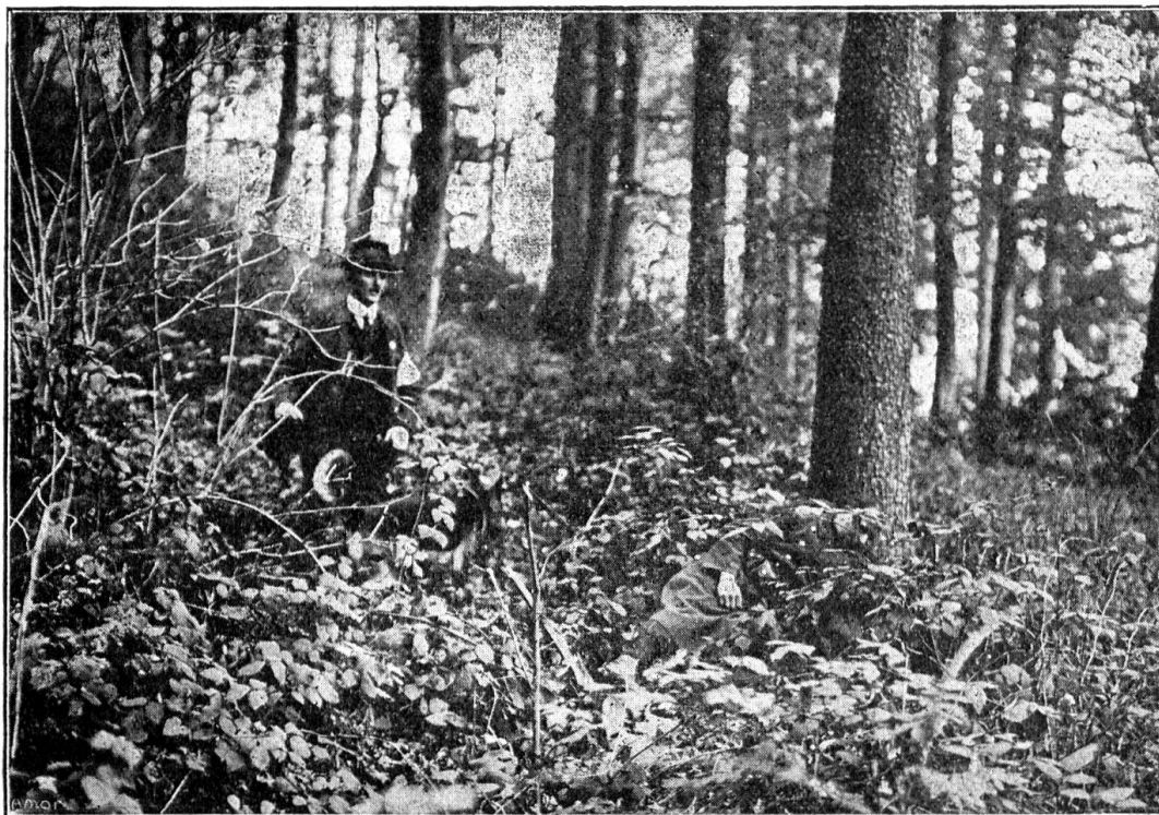
Un autre blessé découvert en forêt par un chien sanitaire

Nous sommes heureux de pouvoir mettre sous les yeux de nos lecteurs un certain nombre de photographies prises lors du « Concours de chiens militaires » qui a eu