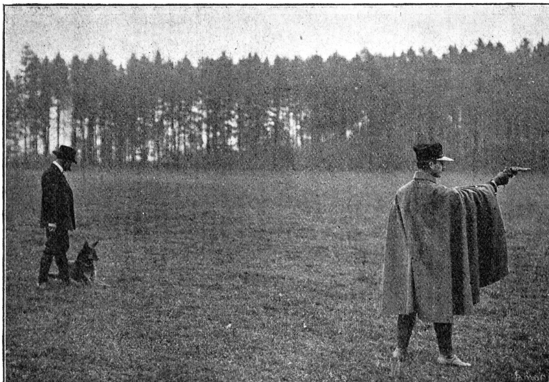
Epreuve du coup de feu. Le chien doit rester tranquillement aux pieds de son maître

en Albanie surtout) a singulièrement compliqué la recherche des blessés.