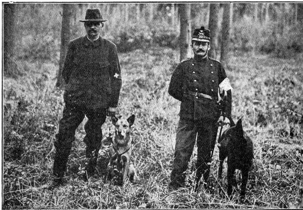
Les chiens sont prêts au départ et vont chercher des blessés dans la forêt

qu'on a retrouvés plusieurs jours après les batailles, et leurs récits prouvent qu'une inspection plus détaillée du terrain