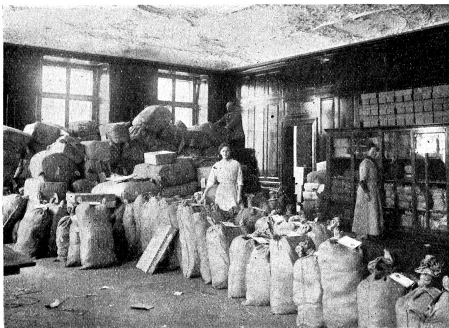
Dépôt central de la Croix-Rouge suisse, à Zurich; les colis prêts pour l'expédition

Comme on peut se rendre compte en examinant et en comparant les deux tableaux des dons et des envois aux troupes , ceux-ci, contrairement aux premiers, vont en augmentant jusqu'à prendre des proportions considérables, tandis que les pre-