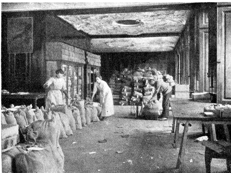
La salle de la préparation des envois aux unités de troupes

Nous ne comptons pas non plus dans les « divers » les envois d'articles comme: tabac, cigares et cigarettes, etc., savon, poudre dentifrice, brosses à dents, etc., conserves, confitures, viandes, etc., articles