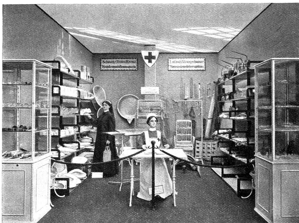
Magasin ou dépôt de matériel sanitaire de la Croix-Rouge suisse