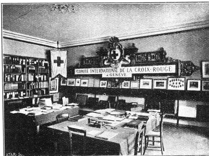
Bibliothèque et Archives du Comité international à Genève, rue de l'Athénée, 3

ramifications dans tous les Etats civilisés, porte en elle-même la glorification de ceux qui l'ont conçue.