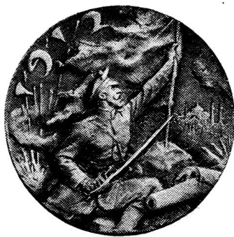
MÉDAILLE COMMÉMORATIVE DE LA GUERRE DES BALKANS