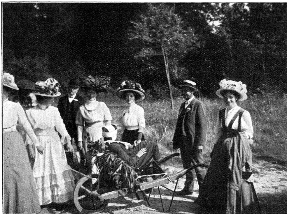
Les samaritains de Fribourg transportent un blessé sur une brouette transformée en voiture à blessés.

porteurs, et 16 relais de brancardiers avaient dû être prévus. Tous les groupes ont travaillé avec beaucoup d'entrain, et ont démontré ce