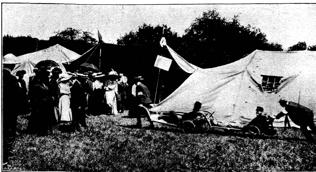
Les tentes montées par les samaritains de Genève, lors de l'exercice du 29 juin

Le cantonnement des samaritains comprenait en outre une cuisine volante dont MM. Buisson et La Chapelle étaient les maîtres-coq. Ils méritent de sincères félicitations; ils ont su préparer un excellent