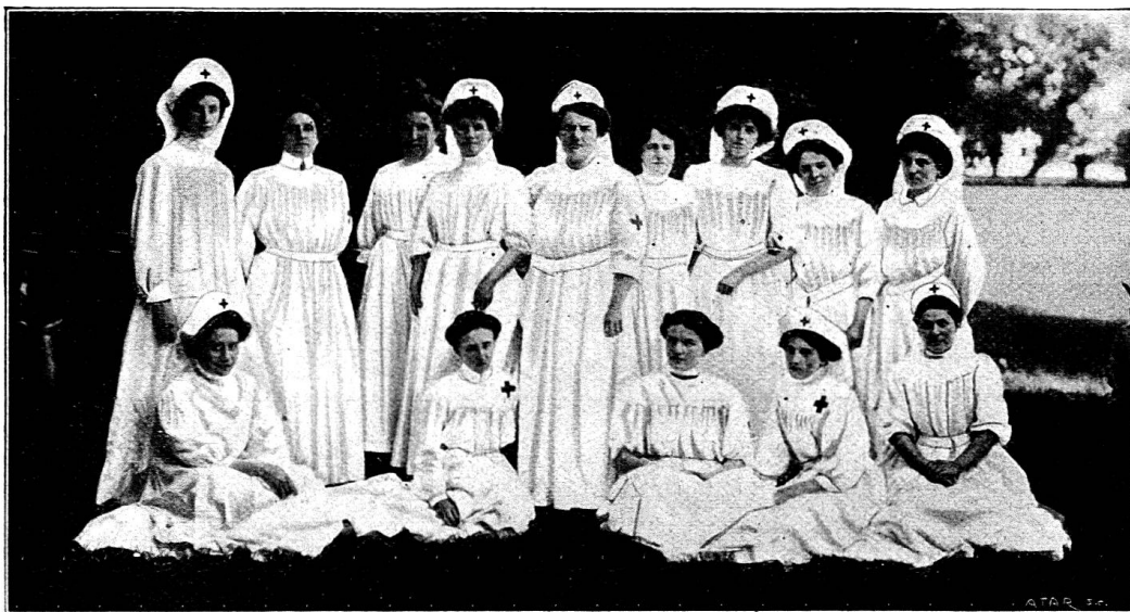
Un groupe de samaritaines-ambulancières de la société de Genève

Il est à prévoir que la première colonne auxiliaire de transports de la Suisse romande sera bientôt constituée à Genève