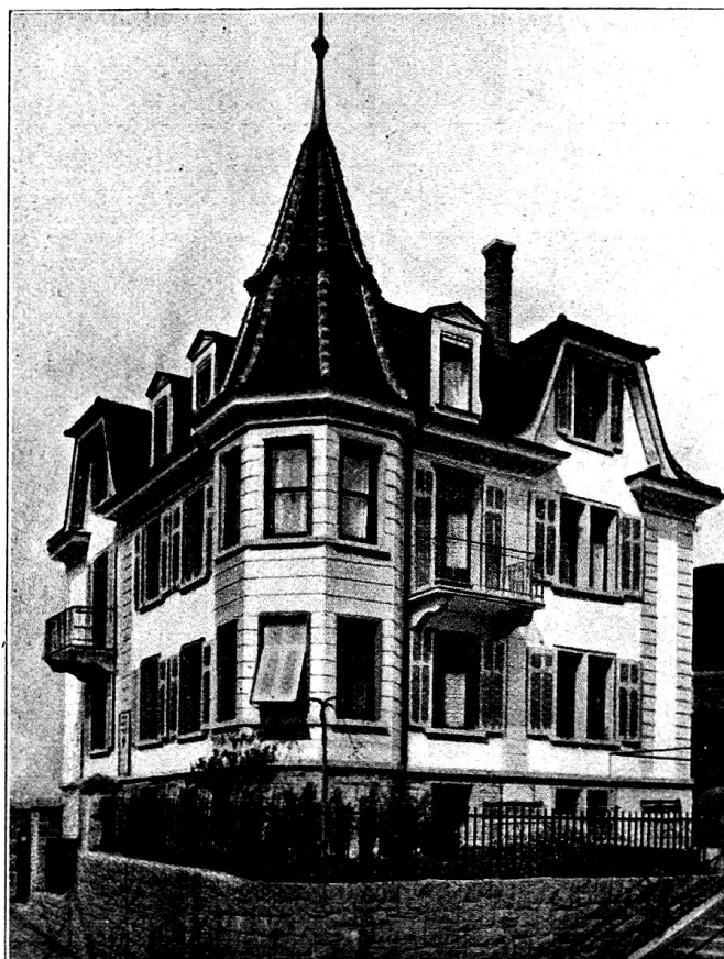
Le Home des infirmières de la Croix-Rouge à Lucerne

commission des transports, donne un aperçu sur les colonnes de transport auxiliaires de la Croix-Rouge suisse. Il en existe 10 aujourd'hui. Il s'agit de les doter de véhicules pratiques pour l'évacuation des malades et des blessés. La commission s'est arrêtée à un modèle de fourgon contenant 10 brancards roulants (voir à