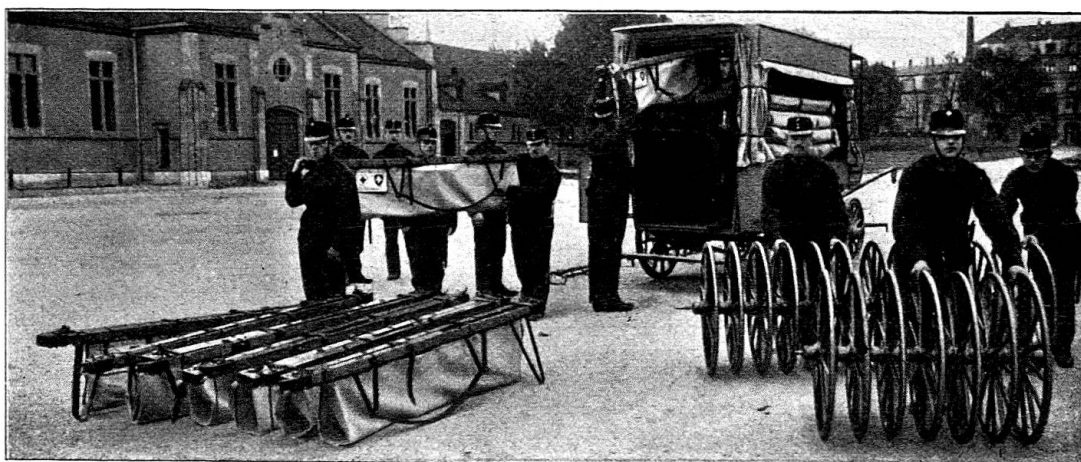
Fig. 2. Déchargement des branchards sur roues.

branchards-roulants. Les cadres et les toiles constituant ces branchards sont suspendus sous la toiture du fourgon, tandis que les