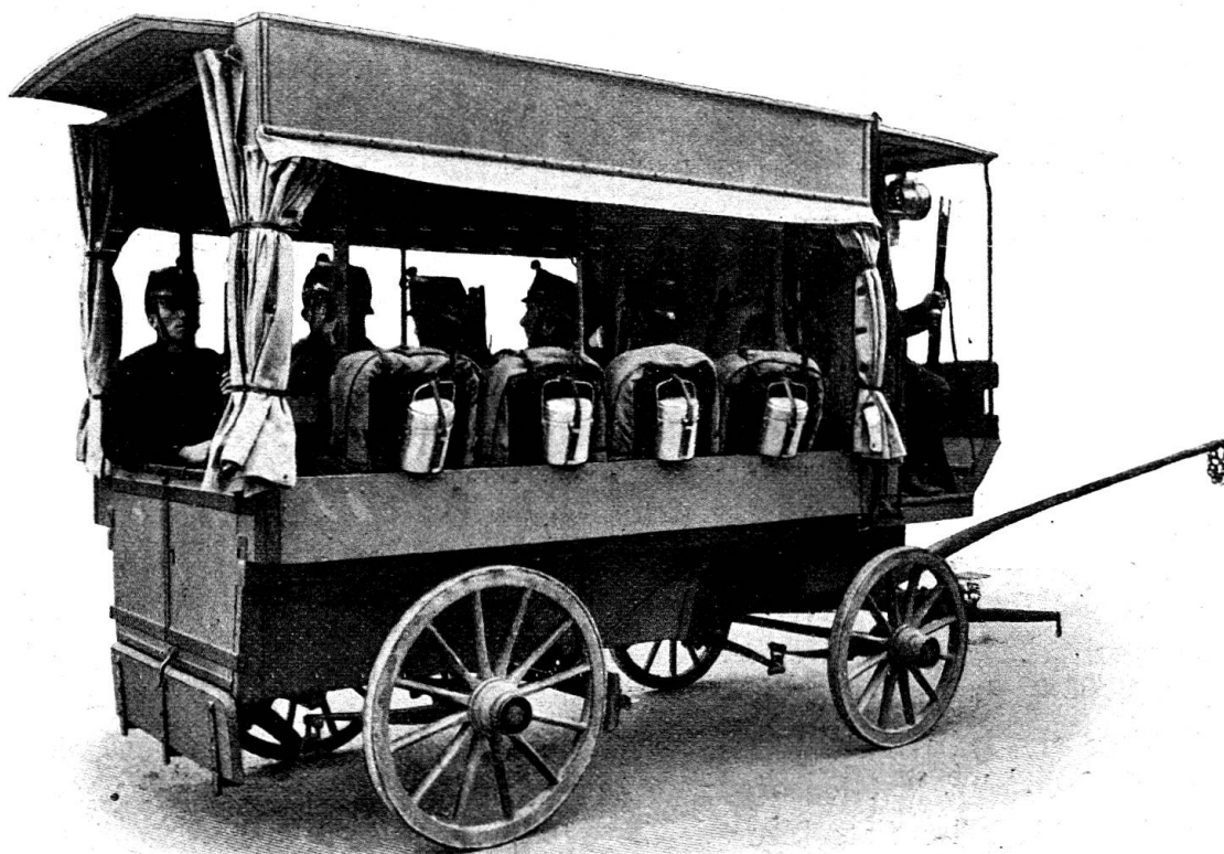
Fig. 4. Le fourgon aménagé pour le transport de 10 hommes atteints de blessures légères.

Lorsque 10 soldats remplacent les brancards que contenait la voiture, celle-ci ne pèsera guère que 100 kilogrammes de plus. Deux chevaux suffisent encore à ce nouveau transport.