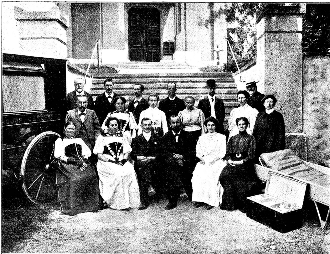
Pl. 3. La nouvelle société de samaritains de Kirchdorf-Gerzensée.

avec la voiture de malades dont cette section a fait dernièrement l'acquisition. Quel-