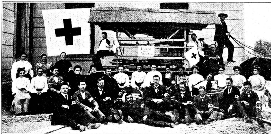
Pl. 4. Les samaritains de Wettingen et le char à blessés qu'ils ont aménagé.

vues que nous reproduisons, de montrer quels genres d'exercices peuvent et doivent être exécutés par les sociétés de samaritains, afin d'encourager les membres de ces sociétés à travailler, et peut-être à