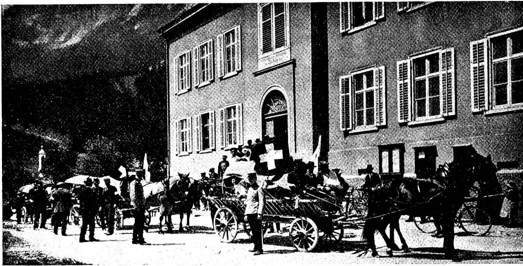
Pl. 2. Arrivée des blessés sur des chars de fortune.

La planche 3 nous montre la société des samaritains de Kirchdorf-Gerzensée