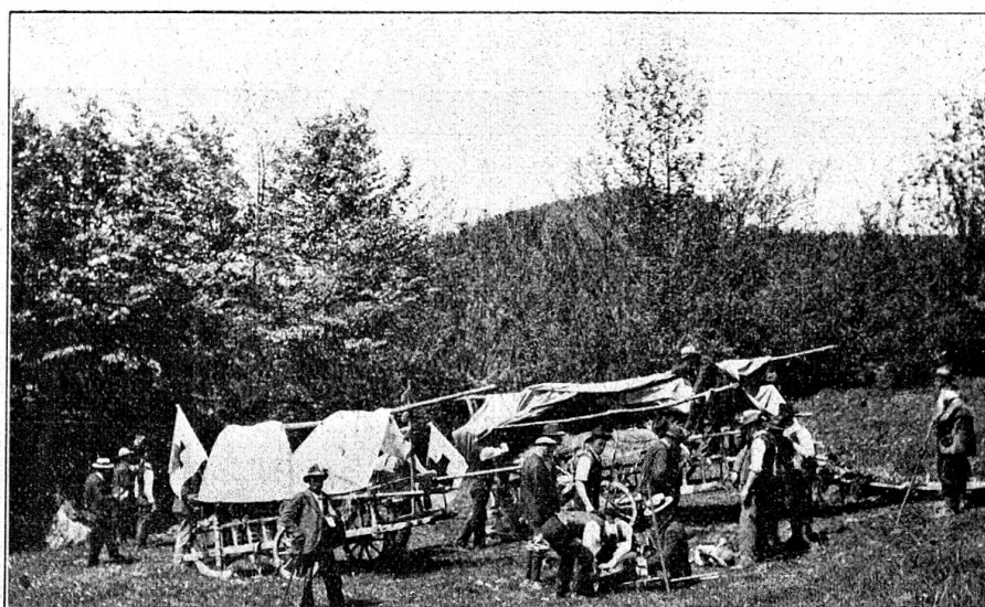
Fig. 1. Haquets à fourrage prêts à recevoir les blessés.

improviser un Poste de Secours derrière la ligne de feu, et, dans ce but, arranger et préparer du matériel de secours (attelles, véhicules