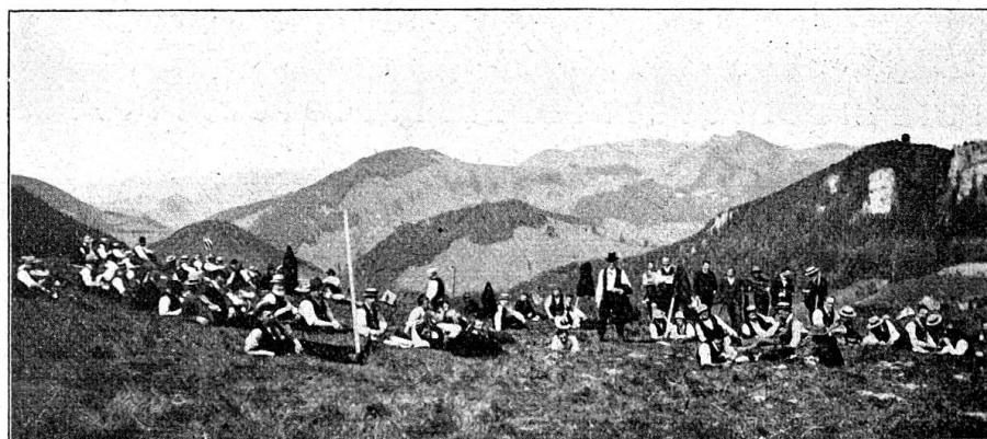
Fig. 2. Le déjeuner au pâturage.

La fig. 1 représente deux haquets à fourrage