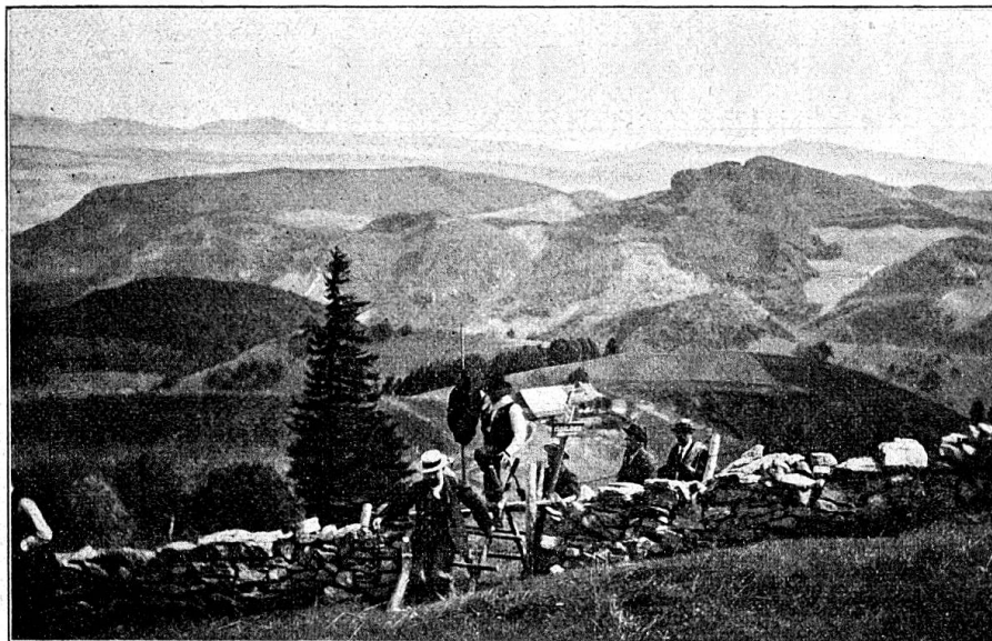
Fig. 3. A la recherche des blessés.

Ce dernier avait été organisé entre temps