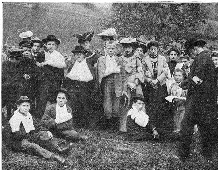
N° 1 er

sanitaire et la colonne de transports auxiliaire récemment créée à Glaris sous le